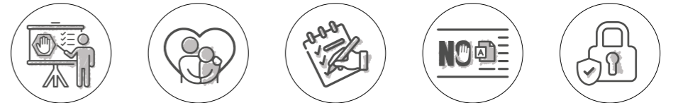
COMPRESIÓN APOYO RESPUESTA INFORME SEGURIDAD EN LÍNEA

Esta violencia en línea afecta seriamente la libertad de prensa, restringiendo la expresión en línea de las periodistas. Si bien las plataformas en línea intentan prevenir los ataques en línea, y los Estados se esfuerzan por enjuiciar a los perpetradores de estos actos, los periodistas pueden adoptar ciertas medidas para protegerse mejor a sí mismos y a sus equipos. Esta guía está destinada a ayudar a las periodistas a afrontar los desafíos de la violencia en línea.